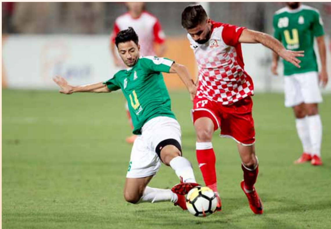
لقطة من إحدى المباريات التي جمعت الوحدات وشباب الأردن بالموسم الماضي

حين وقعا بالمجموعة الأولى التي ضمت أيضا شباب الحسين، الفيصلي والأهلي، والتي تصدرها شباب الأردن برصيد ٢٠ نقطة، والوحدات حل ثانيا برصيد ١٤ نقط، وحين تقابلا ذهابا تعادلا بنتيجة ٠-٠، وايابا فاز شباب الأردن بنتيجة ٣-٢. والتقى الوحدات وشباب الأردن للمرة الثالثة بمسابقة الدرع موسم ٢٠٠٨، حين