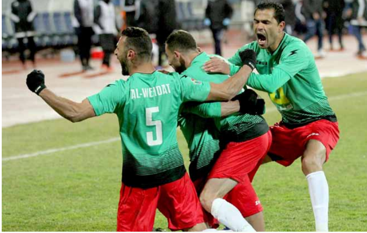
فرحة وحدائية مشروعة بالفوز على السلط