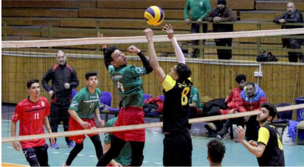
هدير الوحدات الهجومي احبط البقعة