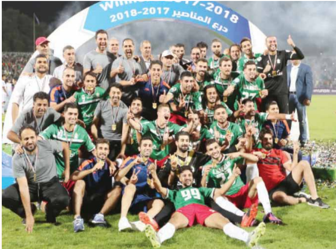
تتويج الوحدات بلقب درع اتحاد الكرة موسم 2017-2018

وعند استعراض لوحة شرف لقب درع اتحاد الكرة، نجد انها عاشت في سباق ملتتهب نحو ضمه منذ العام ١٩٨١، ونجد أيضا دليلا واقعا يحمل الإجابة الشافية والمقنعة، على السؤال المطروح: "هل تنظر أندية المحترفين لبطولة درع اتحاد الكرة بأنها استعدادية أم تنافسية؟"، ويؤكد نظرة الأندية التنافسية، حيث توج فريق الجزيرة بأول القاب البطولة العام ١٩٨١، ويحمل الوحدات الرقم القياسي لعدد مرات الفوز باللقب برصيد ٩ ألقاب في الأعوام ٨٢، ٨٣، ٨٨، ٩٥، ٢٠٠٢، ٢٠٠٤، ٢٠٠٨، ٢٠١٠، ٢٠١٨، يليه المنافس التقليدي فريق الفيصلي الذي فاز باللقب ٧ مرات، في الأعوام ٨٧، ٩١، ٩٢، ٩٧، ٢٠٠٠، ٢٠٠٩ و ٢٠١١، والرمثا ٥ مرات في الأعوام ٨٩، ٩٠، ٩٣، ٩٦، ٢٠٠١، والحسين إربد ٣ مرات في الأعوام، ٩٤، ٢٠٠٣ و ٢٠٠٥، والجزيرة مرتين في العامين ٨١ و ٨٦، وعمان مرتين في العامين ٨٤ و ٨٥، وشباب الأردن مرتين أيضا في العامين ٢٠٠٧ و ٢٠١٧، واليرموك مرة واحدة العام ٢٠٠٦، وكذلك فريق كفرسوم الذي فاز باللقب العام ٩٨.