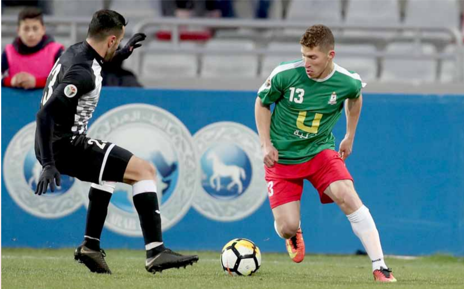
جانب من مباراة شباب الأردن والوحدات في مواجهة سابقة بين الفريقين بالموسم الماضي