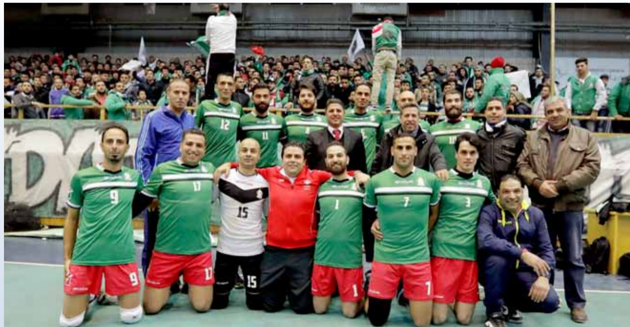
فريق الوحدات لكرة الطائرة يستعد للموسم الجديد بمهمة قوية

ونوه فاضل إلى أن الوحدات يمتلك حالياً كوكبة من اللاعبين الشباب مشيراً إلى أن الوحدات باتت مطالباً بضرورة أن يكون هناك حزم في مسألة اختيار اللاعبين وتأهيل أبناء النادي لأن يمثلوا الفريق خلال الموسم الحالي والموسم المقبل بشعار "صنع في الوحدات".