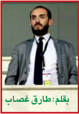
بقلم: طارق غصاب

صلاح وحرز وزياش والنصيري وغيرهم من اللاعبين الذين أمتعونا بمهاراتهم وأهدافهم، إلا أننا كذلك نملك الفرصة لتسليط الضوء على مشروع لاعب عربي يلعب في مركز يحتاج الكثير من العمل والمهارات والقوة لم نعتد على تواجدهم ممثلين عرب لنا فيه في أكبر الأندية العالمية ومؤخراً أصبح بن ناصر ركيزة أساسية في خط وسط ميلان بأداء جميل كالمكوك في كل مكان بالملاعب وارتفع سقف التوقعات الخاصة فيه يوماً بعد يوم! اليوم نقف فخورين بنماذج عربية منتشرة بأوروبا مثل