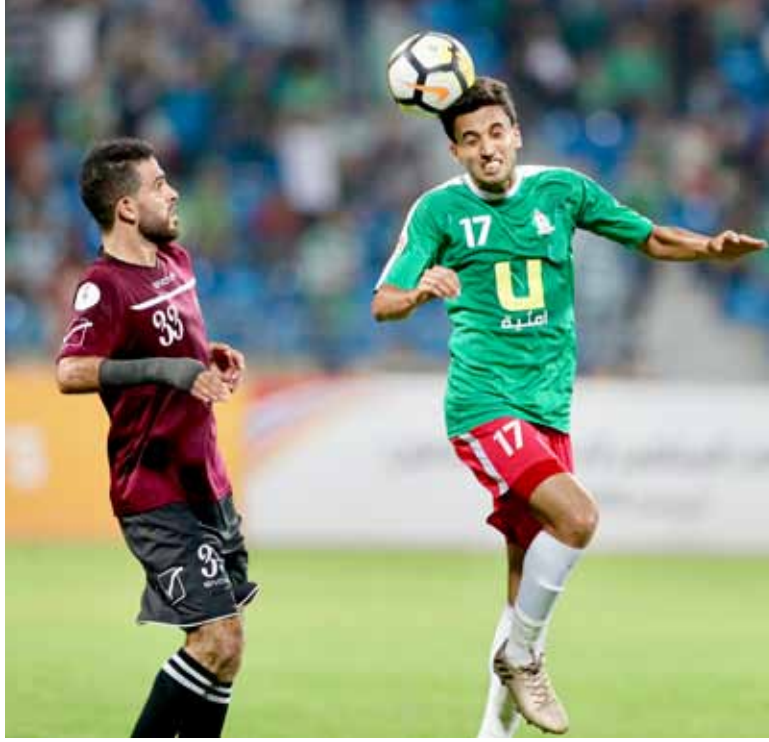
جانب من مباراة الوحدات والأهلي خلال منافسات دوري 2018-2019

الجمعة ٤/١٠، على استاد عمان الدولي بالاسبوع الخامس، ويلقي شباب الأردن عند الساعة الخامسة يوم الجمعة ٤/١٧، على استاد الملك عبدالله بمنطقة القويسمة لحساب الاسبوع السادس، ويلقي الحسين اريد عند الساعة السابعة والنصف من يوم الثلاثاء ٤/٢١، على استاد عمان الدولي، لحساب الاسبوع السابع، ويلقي سحاب عند الساعة ١١ من يوم الجمعة ٥/١، على استاد الملك عبدالله بمنطقة القويسمة، لحساب الاسبوع الثامن، ويلقي الجزيرة عند الساعة ١١ من يوم الخميس ٥/٧، على استاد عمان الدولي، لحساب الاسبوع التاسع، ويلقي الصريح عند الساعة ١١ من يوم الجمعة ٥/١٥، على استاد الحسن ياربد، لحساب الاسبوع العاشر، ويختتم مرحلة الذهاب بلقاء الفيصلي، عند الساعة ١٢ من يوم الخميس ٥/٢١، على استاد عمان الدولي، لحساب الاسبوع الأخير من مرحلة ذهاب الدوري.