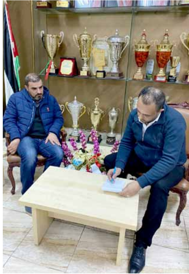
النمر في حديثه لمندوب "الوحدات الرياضي"

وتوقف النمر على ترانيم أهاريح الجماهير "إي ترك مدرستو والي ترك أشغالو" مشيراً إلى أنه أصر على الحضور والتواجد في نهائي بطولة الدرع التي جمعت الوحدات والرمثا، رغم ارتباطه الوثيق بأعماله الخاصة إلا أن عشق الوحدات اللامتناهي لديه على حد قوله أجبره على الحضور خلف الوحدات في هذا اللقاء والذي لم