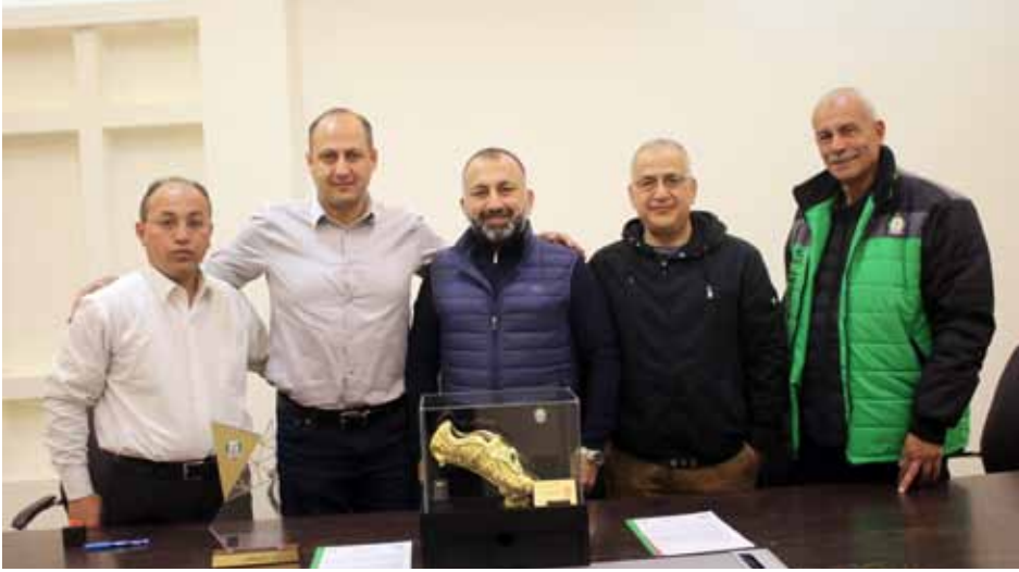
الوحدات يقبل شاهين العضوية الذهبية