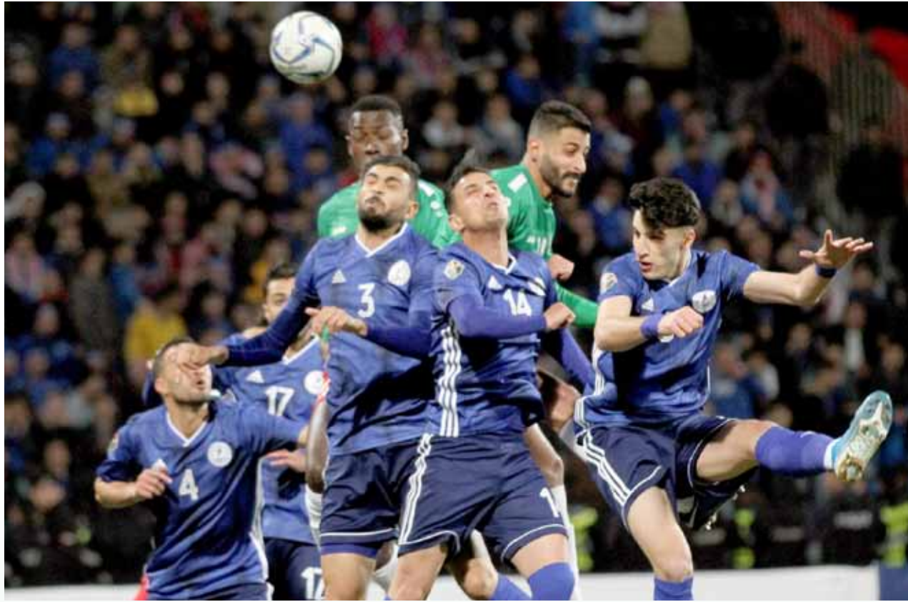
قمة الوحدات والرمثا خضراء بامتياز