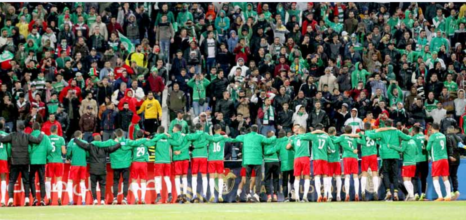
فرحة اللاعبين مع الجماهير مشروعة