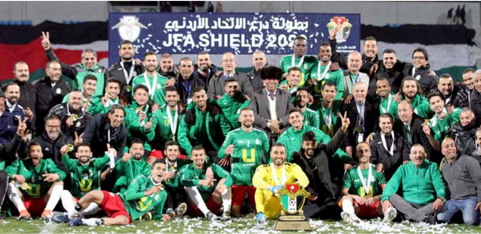
الوحدات بطلاً عن جدارة واستحقاق