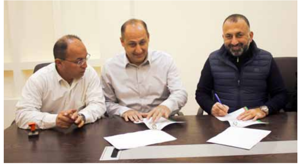
جانب من حفل توقيع الاتفاقية